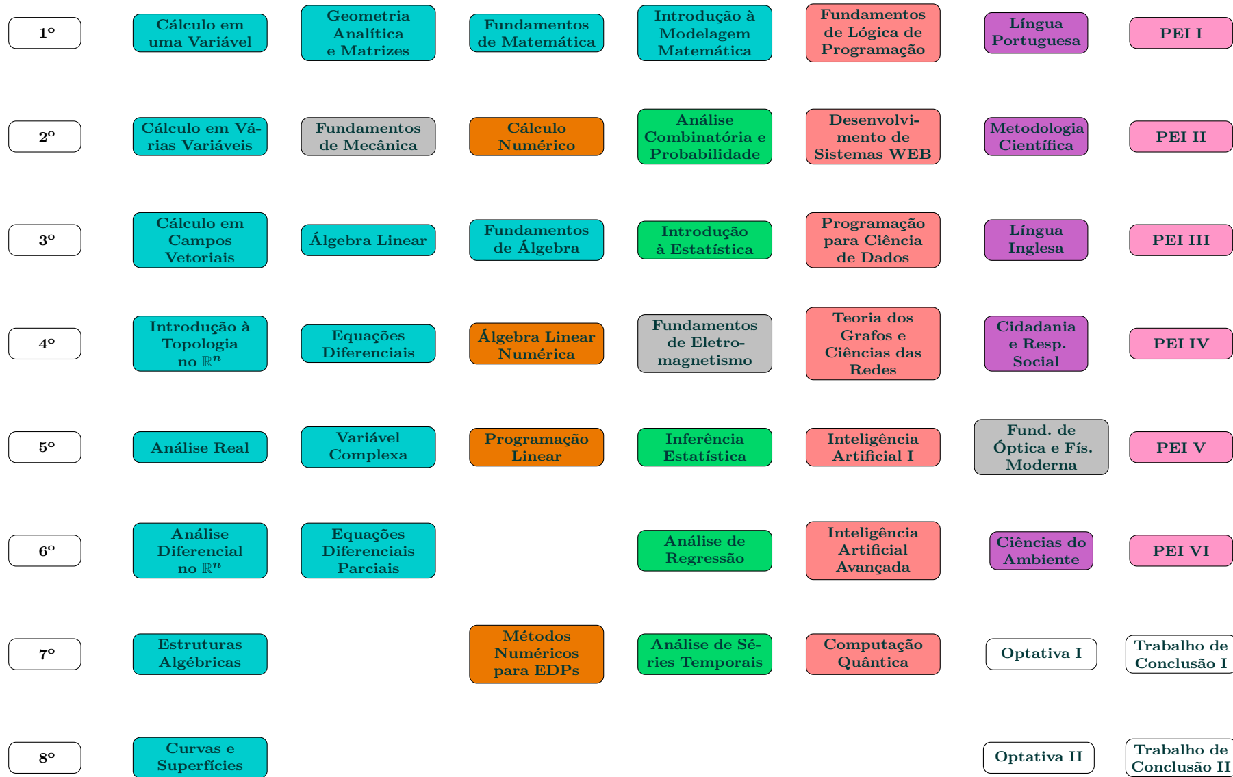
Figura 2 – Fluxograma do Curso de Matemática Tecnológica.