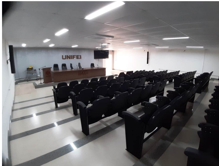
Figura 6.1.: Auditório do Instituto de Matemática e Computação

Todos os docentes estão alocados nas dependências do IMC, em gabinetes individuais climatizados, com micro-computador com acesso à Internet e sistema de telefonia. Os gabinetes também possuem mobiliário adequado para o atendimento dos discentes. O IMC possui duas salas disponíveis para reuniões do colegiado, do NDE, empresas ou alunos, bem como um auditório com capacidade de 70 pessoas.