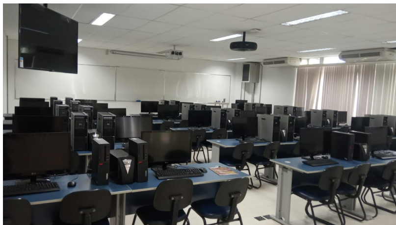
Figura 6.3.: Laboratório Didático de Computação 2