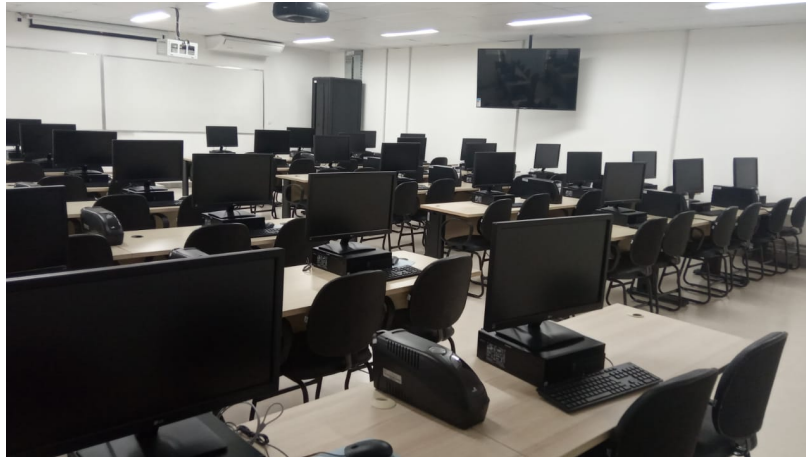
Figura 6.4.: Laboratório Didático de Computação 6