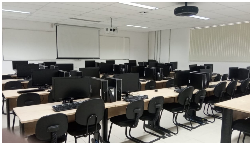
Figura 6.2.: Laboratório Didático de Computação 1

Os LDCs possuem computadores com processadores Intel Core i3 a i7, memória RAM de 4GB a 12GB, discos rígidos e SSDs ( Solid State Drives ) de 500GB a 1TB, monitores de LCD e nobreaks. Todos estão configurados com softwares como: ambientes de programação, compiladores, banco de dados, desenvolvimento web, ambientes simulados e virtualizados, resolução de problemas multidisciplinares e dinâmicas de grupos. Há também kits com placas micro-controladas e sensores para serem agregados nesses ambientes. Os LDCs dispõem de mobiliário, ar-condicionado, sistema multimídia e projetores para a realização das aulas práticas do curso, incluindo atividades de pesquisa e monitoria. As Figuras 6.2, 6.3 e 6.4 mostram exemplos de alguns dos LDCs disponíveis.