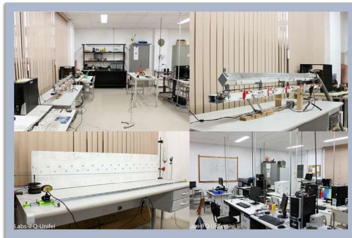
Figura 5.8: Alguns experimentos do laboratório Remoto de Física