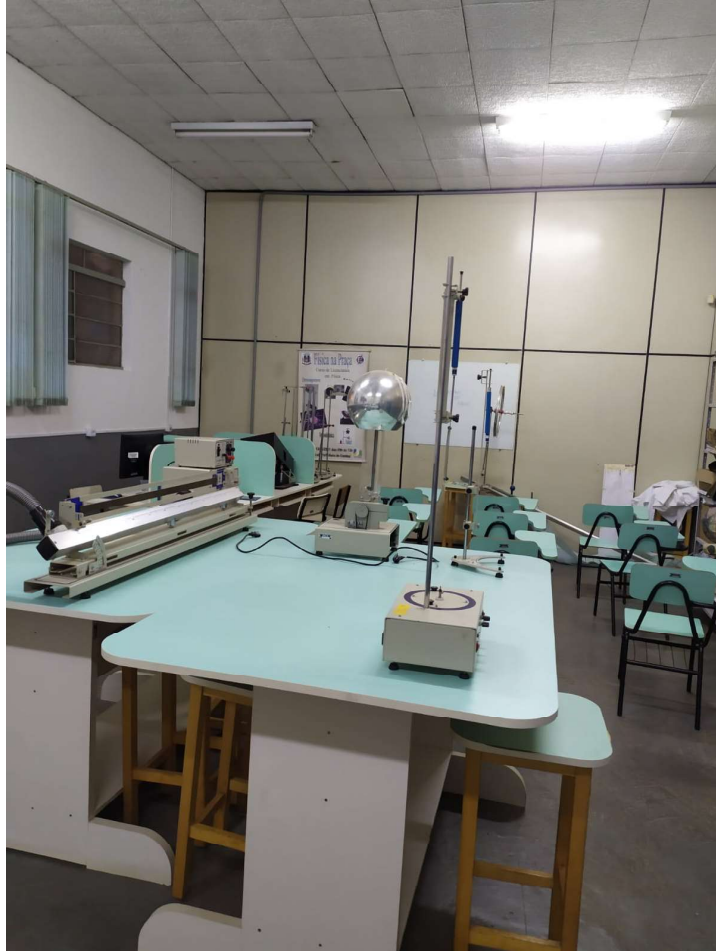
Figura 5.2: Foto do laboratório didático de física do polo da cidade de Cambuí em Minas Gerais