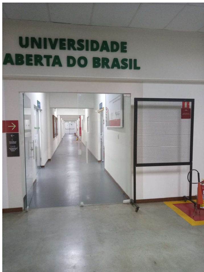
Figura 5.3: Foto da entrada das salas e laboratório de polo de São José dos Campos no estado de São Paulo.