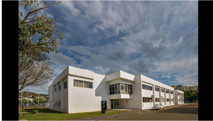
Figura 5.1: Instituto de Física e Química (IFQ)

IFQ, os docentes também realizam atividades presenciais nos polos de apoio. Os polos de apoio presencial contam com a infraestrutura exigida pela Universidade Aberta do Brasil (Figura 5.3):