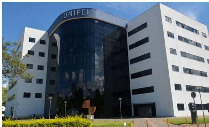
Figura 5.7: Prédio Central da UNIFEI: Principal espaço administrativo da instituição, congrega as sedes da Reitoria, de todas as Pró-Reitorias, além dos espaços de reuniões do Consuni e do CEPEAd.