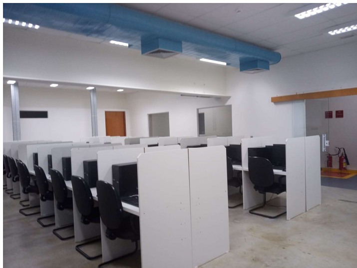
Figura 5.4: Foto do laboratório de Informática do polo de São José dos Campos no estado de São Paulo.