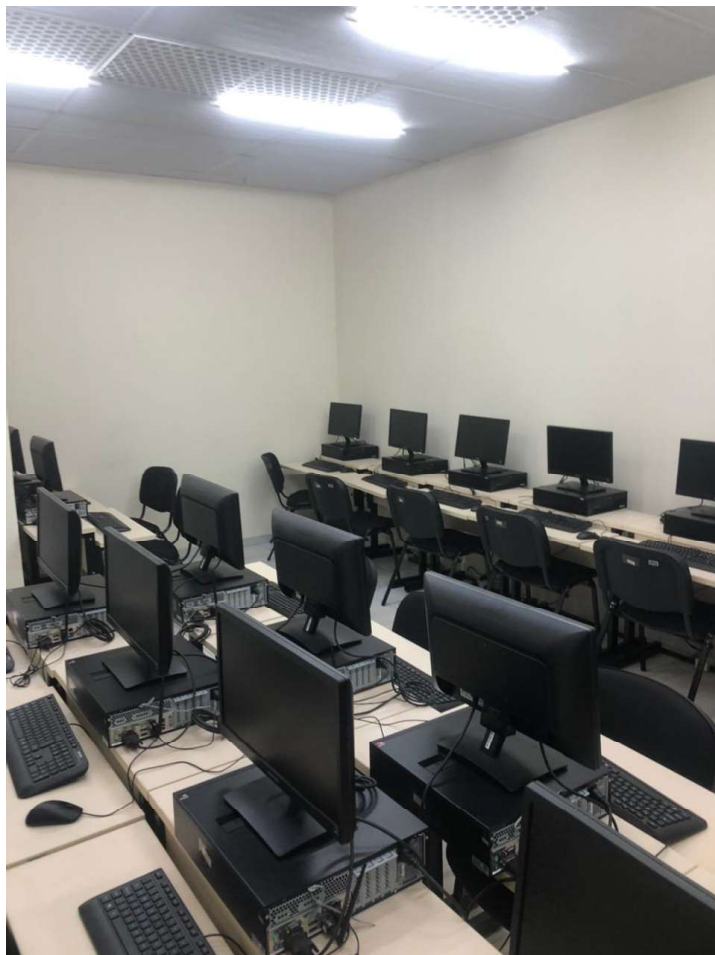
Figura 5.6: Foto do laboratório de informática do polo de Itamonte em Minas Gerais

Prédio Central da UNIFEI (Figura 5.7): Principal espaço administrativo da instituição, congrega as sedes da Reitoria, de todas as Pró-Reitorias, além dos espaços de reuniões do Consuni e do CEPEAd.