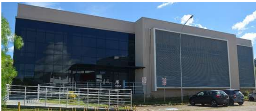
Figura 5.9: Prédio do Centro de Educação.